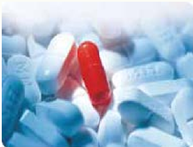
▲ 安眠藥、抗憂鬱的藥